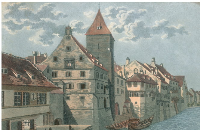
La maison du sel et la tour du sel depuis le Schiffflände. Derrière l'auberge Drei Könige (avant 1830).

L'existence de l'auberge «Drei Könige» ou «Zu den Drei Königen» au Blumenrain 8 à Bâle est mentionnée pour la première fois en 1681. Elle est proche des voies de transport de personnes et de marchandises, sur terre ou sur l'eau, dans le voisinage immédiat du Schiffflände.