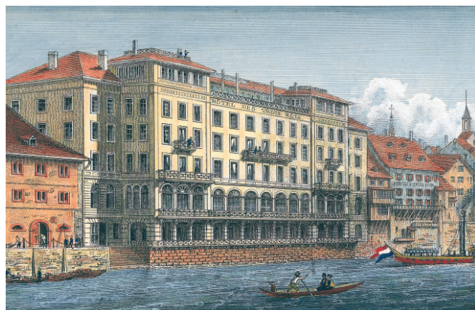
Vue de l'ancienne auberge avec les trois figurines des rois après 1833.

Le 16 février 1844, l'Hôtel «Des Trois Rois» ouvre ses portes. Aux mains de différents propriétaires successifs, il devient célèbre dans le monde entier. En 1936, la direction de l'hôtel est confiée à des personnes externes. Le bâtiment fait l'objet de plusieurs rénovations partielles. En 1976, la société du comte français Guy de Boisrouvray reprend l'Hôtel «Des Trois Rois». Sa fille le revend en 2000 au groupe Richemond.