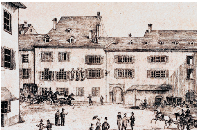
Vue de l'hôtel en 1844.

«Drei Könige» – qui signifie «Trois rois» – est un nom très répandu parmi les maisons d'hôtes et les auberges jalonnant les routes du commerce. Il évoque les mages de la Nativité venus d'Orient, dénommés «Gaspard, Melchior et Balthazar» dans le langage populaire, ou bien sûr: «les trois Rois Mages».